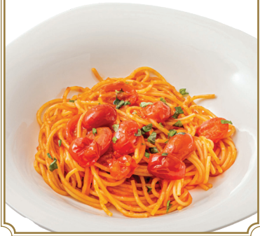
Tomato Spaghetti 番茄意大利粉