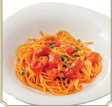
Tomato Spaghetti 番茄意大利粉