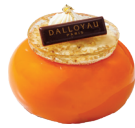
Apple Osmanthus Glow 蘋果桂花慕絲蛋糕